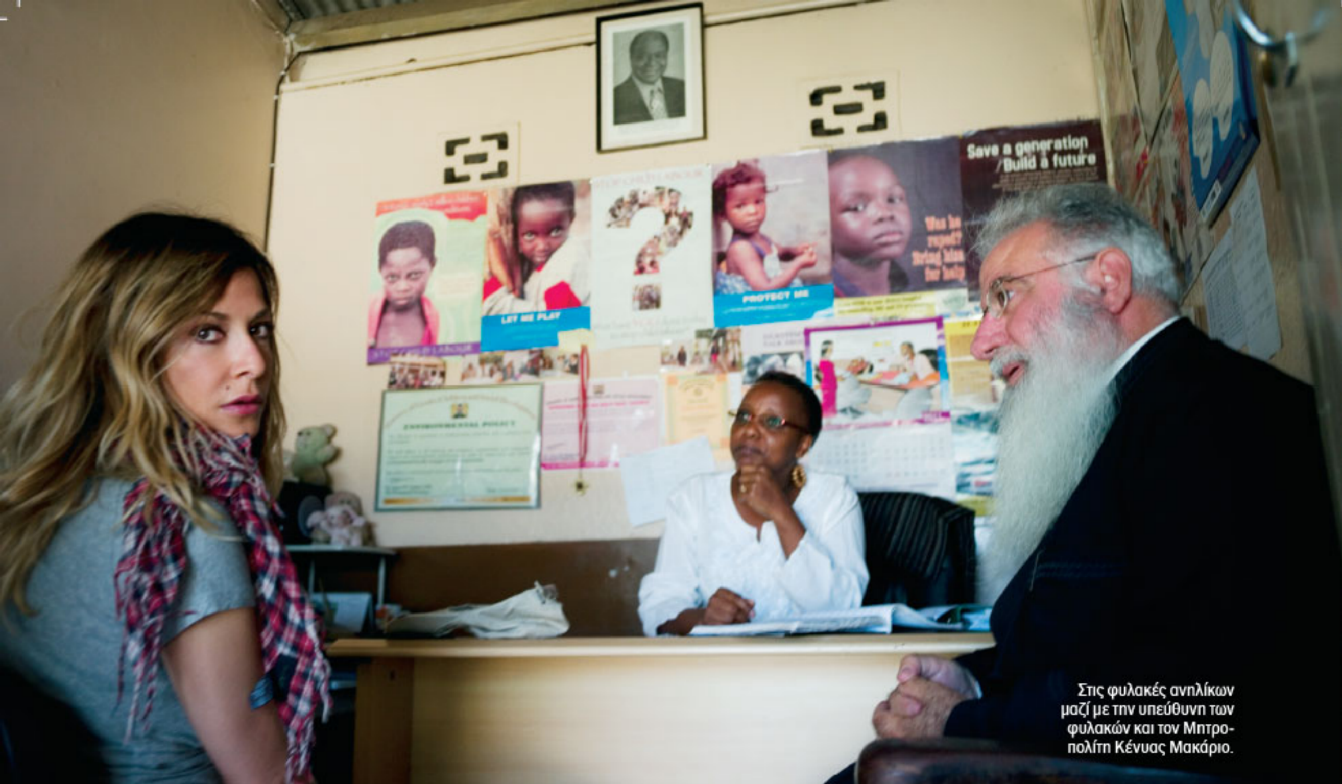
Στις φυλακές ανηλίκων μαζί με την υπεύθυνη των φυλακών και τον Μητροπολίτη Κένυας Μακάριο.

«Σίγουρα, θέλω να έρθω ξανά. Ξέρω ότι έχω ανοίξει μια υπόθεση, έναν άλλο κύκλο και θέλω να έρθω όσες περισσότερες φορές τα καταφέρω και να προσφέρω με όποιο τρόπο μπορώ».